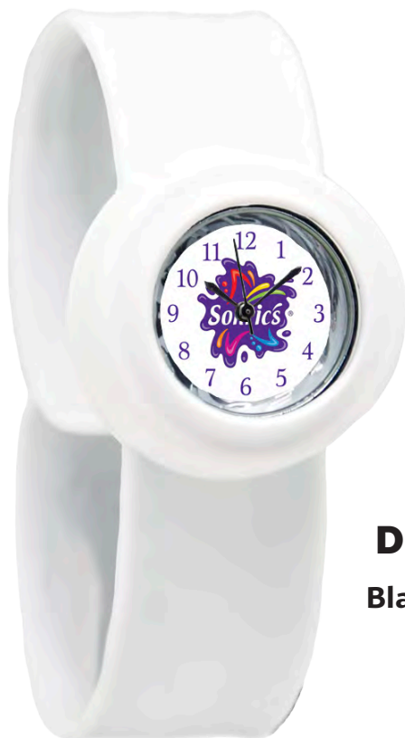
D Blanco 21 Piezas Disponibles