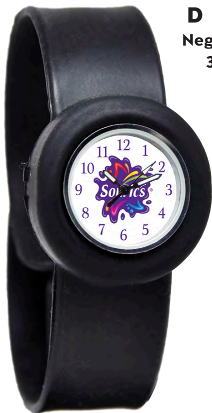
D Negro 33 Piezas Disponibles